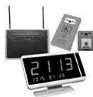
Системы вызова помощи ТИФЛОВЫЗОВ ПС-1999