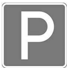
Знак парковочного места для инвалидов