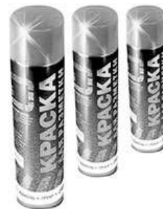
Краска для нанесения разметки на асфальт