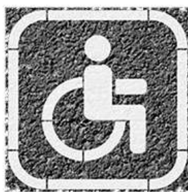
Трафарет для нанесения разметки